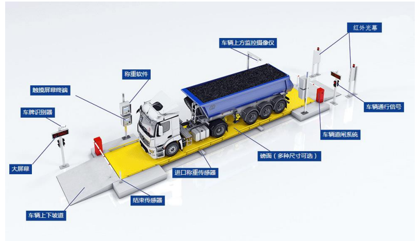
无人值守系统电子汽车衡